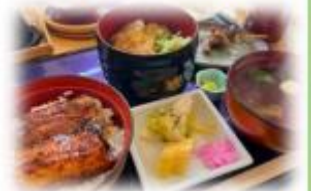
浜名湖の鰻で パワーアップ！