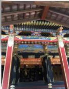
眼下に駿河湾を見下ろす 国宝「久能山東照宮」