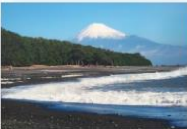
世界遺産「三保の松原」の絶景