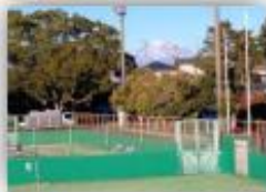
草薙運動場庭球場 / 有度山総合運動場テニスコート ※2会場26面をご用意

5月13日(月)14日(火)、静岡市にて「第25回 井上早苗杯 GOGOテニスフェスティバル by DUNLOP 2024」が開催されます。今大会は生涯スポーツ普及の一環として始まったもので、優勝者には、故井上早苗元会長寄贈の歴代優勝者の名が刻まれた銀のプレートが授与されます。全国会員の交流と歴史を感じに新茶シーズンの静岡での大会に出場してみませんか？