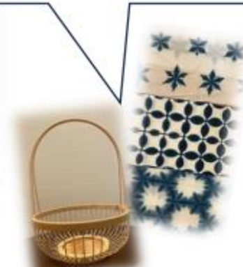
竹細工、藍染め体験の作品たち

伝統工芸体験施設「駿河の工房 匠宿」では、様々な工芸体験も楽しみいただけます。ご予約はコチラから。 https://takumishuku.jp/index.html