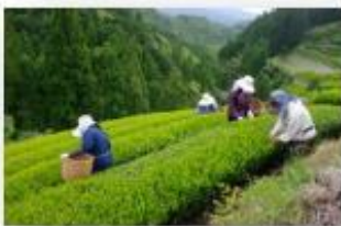
5月は新茶のシーズン 真っ盛り

伝統工芸体験施設「駿河の工房 匠宿」では、様々な工芸体験も楽しみいただけます。ご予約はコチラから。 https://takumishuku.jp/index.html